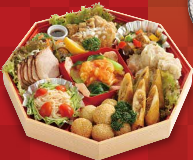
12 中華オードブル 5,400円(税込)