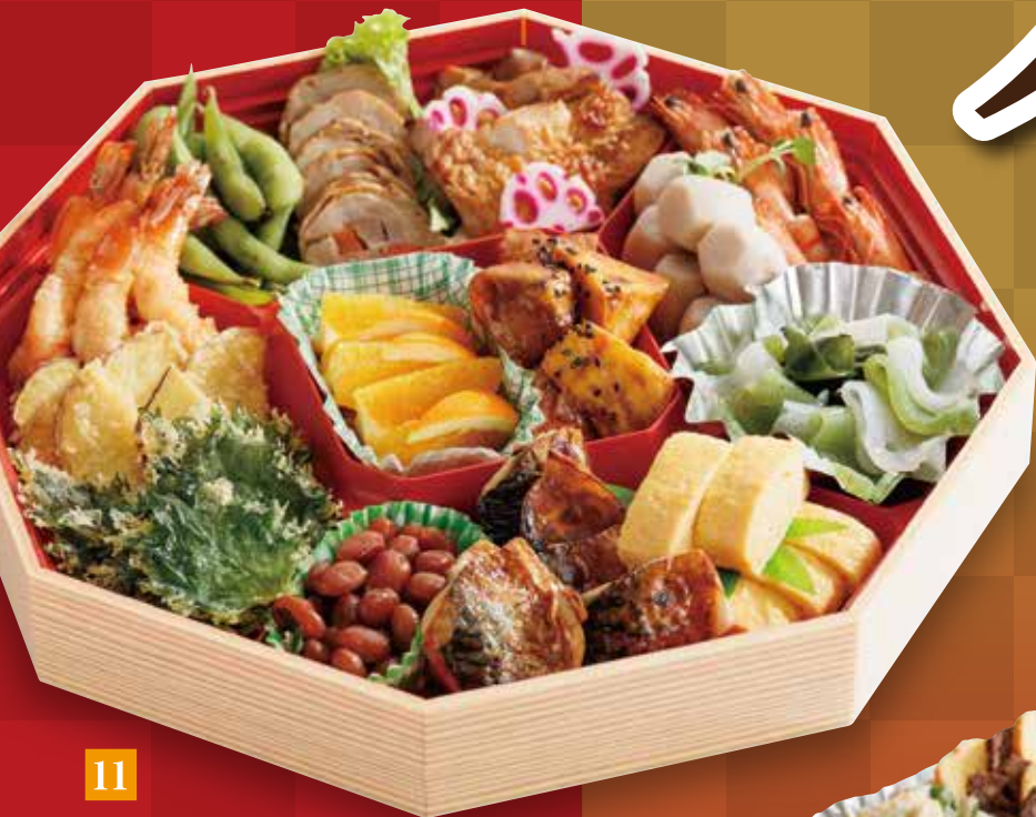
11 和風オードブル 5,400円(税込)