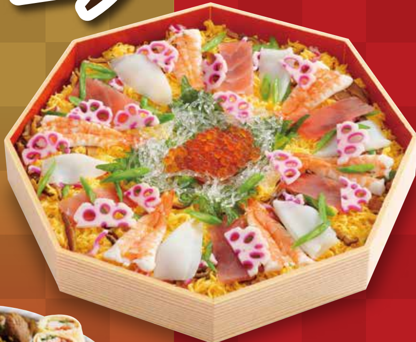
14 海鮮ちらし寿司 4,860円(税込)