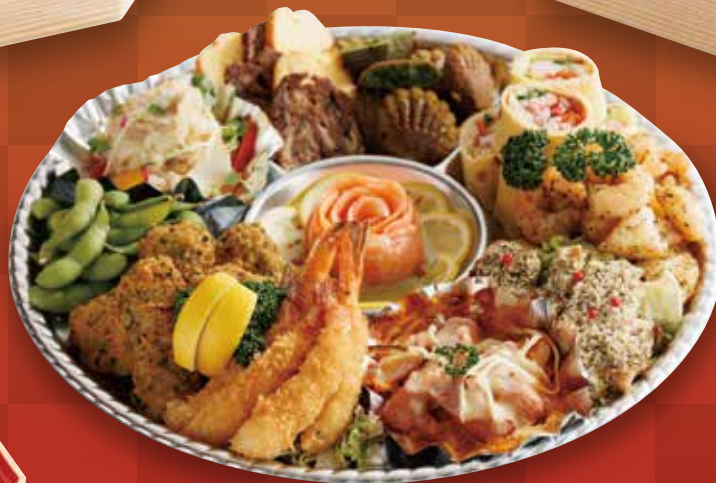
13 洋風オードブル 5,400円(税込)